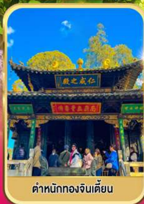
ตำหนักทองจีนเตียน