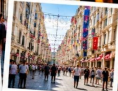
ISTIKLAL STREET (Grand Avenue of Pera) ถนนสายช้อปปิ้ง ยืน 88 ครบรอบในทีเดียว