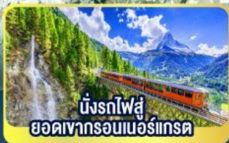
นังรถไฟสู ยอดเขากรอนเนอร์เกรต