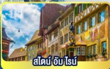
สไตน์ อัม ไรบ์