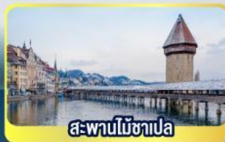
สะพานไม้ซาเปลา