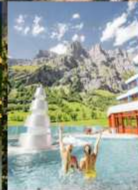
แช่สปปาลอยเทอรันา