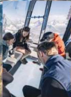
Matterhorn Glacier Paradise