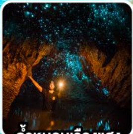
ถ้ำทอนเรืองแสง ไวโตโม