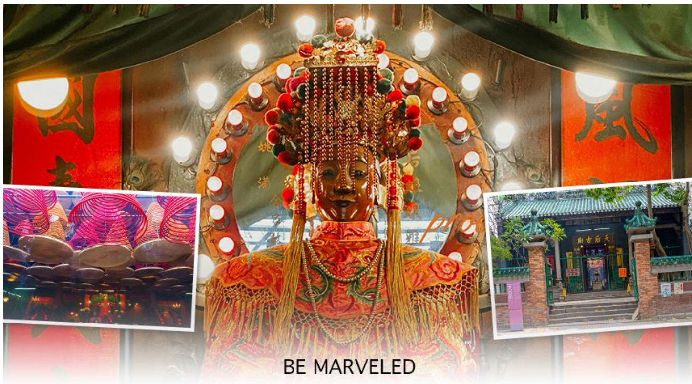
BE MARVELED วัดเจ้าแม่ทับทิมทินฮั่ว

ทองเหลืองอยู่ด้านล่าง นอกจากการมาสักการะบูชาเจ้าแม่ทับทิมในเรื่องของการเดินทางให้ปลอดภัยแล้ว ไฮไลท์สำคัญอีกอย่างหนึ่งของวัดเจ้าแม่ทับทิม ทินฮั่ว (Tin Hau Temple) จะเป็นขดรูปสี่แดงขนาดใหญ่ ที่แขวนอยู่ตามเพดานด้านในวิหารของวัดเต็มไปหมด จะยิ่งสวยงามในยามที่มีแสงแดงส่องลงมาเหมือนเป็นลำแสงส่องทะลุควันรูปแปลกตา ยิ่งนัก ส่วนอาคารของวัดก็จะเป็นสถาปัตยกรรมแบบวัดจีน สร้างขึ้นตั้งแต่ปีค.ศ. 1876 โดยทางเข้าของวัดจะอยู่ติดกับสวนสาธารณะเล็กๆ ที่มีต้นไม้ใหญ่หลายต้น ให้บรรยากาศร่มรื่น