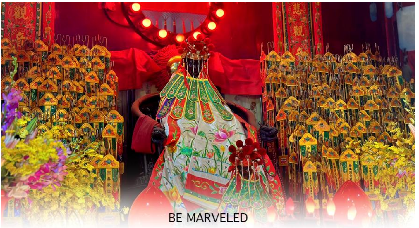
BE MARVELED วัดเจ้าแม่กวนอิมฮองอำ (ยิมฮิน)

ให้เดินทางกลับไปกราบไหว้ และขอบคุณเจ้าแม่กวนอิมอีกครั้ง โดยเตรียมชุดไหว้และกระดาษเงินกระดาษทอง ที่เป็นเหมือนเงินที่เรานำมาคืน เป็นการไหว้เพื่อคืนเงินเจ้าแม่กวนอิมนั่นเอง