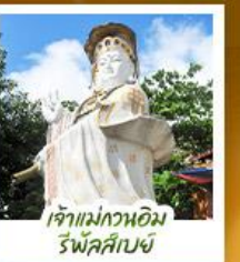
เจ้าแม่กวนอิม รีฟัลส์บีย์