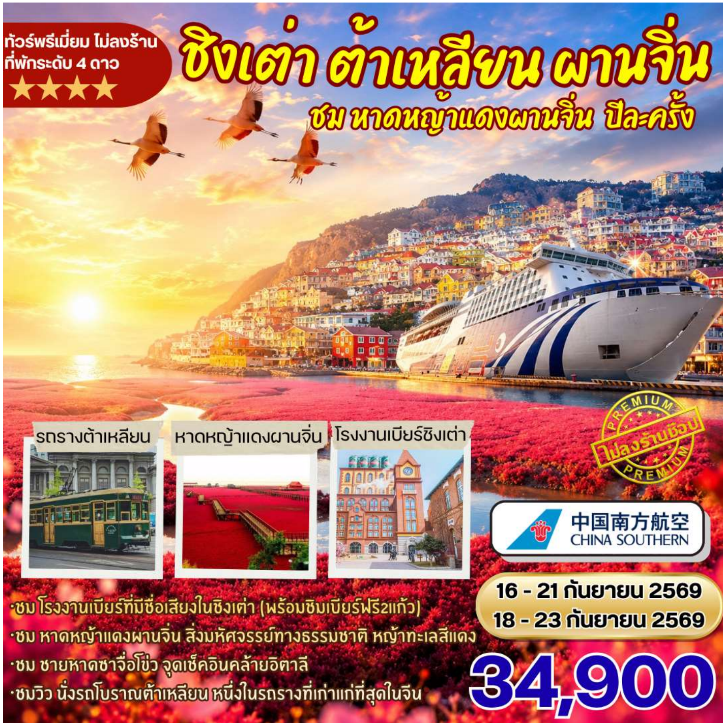
รถรางต้าเหลียน