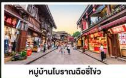
หมู่บ้านโบราณฉีโข่ว