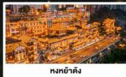
หงหย่าตั้ง