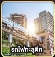
สทไฟกะลุดัก