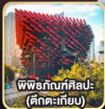
พิพิธภัณฑ์ศิลปะ (ตักตะเกียบ)