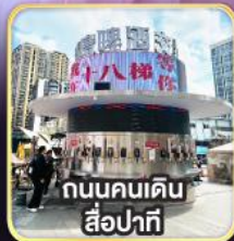
ถนนคนเดิน สือปาที