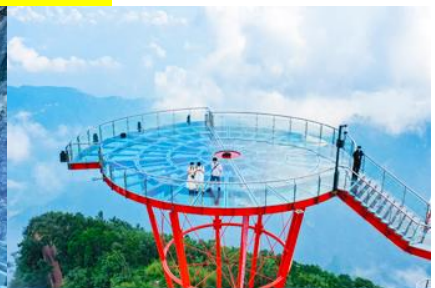
ระเบียงชมวิว Sky Eye