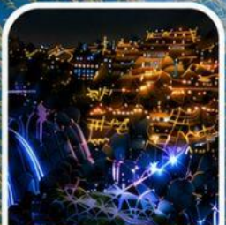
เมืองโบราณฝูหรงเจิน หมู่บ้านโบราณกลางหุบเขา