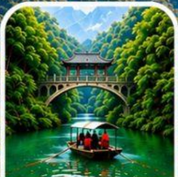
ลำธารหลงจินซี ชมธรรมชาติสุดอลังการ

📷 ชมความงามมุมพิเศษ บุฟเฟ่ต์หมูย่างเกาหลีสุดฟิน