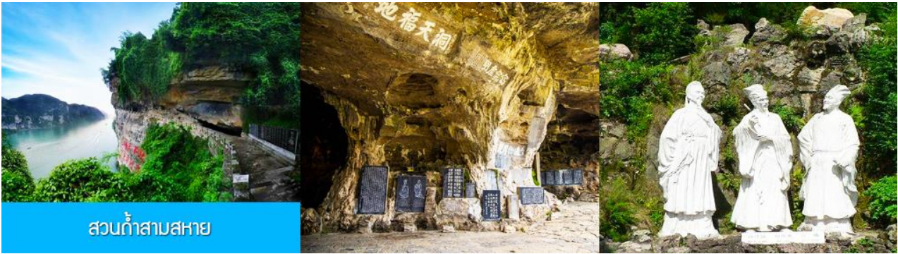
สวนกำสาบสหาย