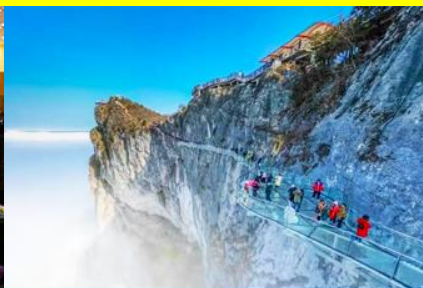
ระเบียงทางเดินกระจกเลียบนหน้าผา