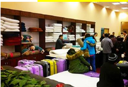
ศูนย์จำหน่ายผลิตภัณฑ์ยาวพารา