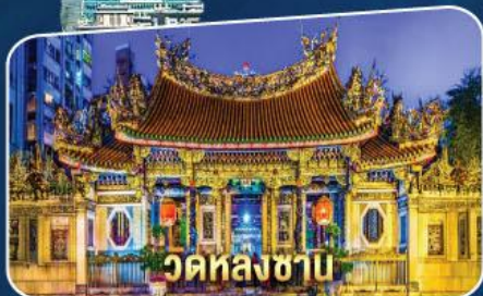
ວັດຫລງສາບ