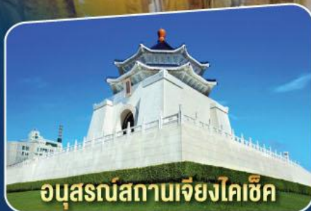
ອນຸສຣນ໌ສາທາຍເຢັຍງໂຄເສັດ