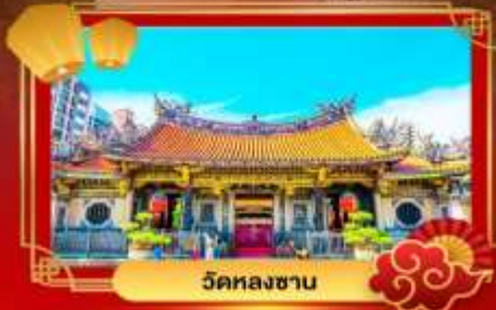
ວັດທລງສາບ